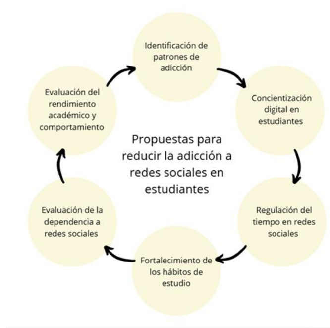
Figura 1. Propuestas para prevenir el incremento de la adicción a las redes sociales en los estudiantes.

A esto se suma que el 40,6% siente a veces la necesidad de revisar redes sociales mientras estudia, el 34,4% rara vez, el 16,9% siempre y el 8,1% nunca, y que el 38,7% ha notado cambios moderados en su comportamiento, el 32,5% leves, el 20% significativos y el 8,8% ninguno. Finalmente, el 43,1% señala que a veces ha logrado reducir su uso de redes sociales, el 27,5% rara vez, el 20% frecuentemente y el 9,4% nunca, lo que evidencia intentos de control que no siempre son consistentes.